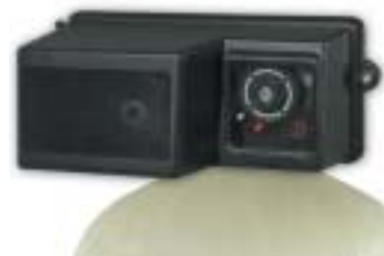
3150 - Soupape de contrôle de 2 po