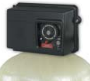
2850 - Soupape de contrôle de 1,5 po