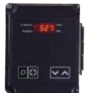
Minuterie pour réseau 3200NT