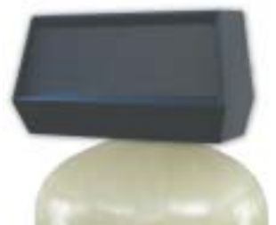
2750 - Soupape de contrôle de 1 po

À chaque année, d'innombrables hôtels, immeubles d'appartements, écoles, industries et hôpitaux dépensent des millions de dollars sur le remplacement de tuyaux et de pièces de plomberie de cuivre rongées par la corrosion, causée par une eau ayant un niveau pH trop bas. Les filtres neutralisants d'Hydrotech ajustent le niveau du pH d'une telle eau agressive de façon efficace et sécuritaire sans l'usage de produits chimiques. Ceci fournit de l'eau conditionnée qui réduit la corrosion et l'endommagement aux conduites de cuivre et élimine toutes quantités élevées de turbidité qui pourraient se former dans l'alimentation d'eau.